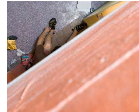
Schuhe, wohin das Auge reicht: Der direkte Vergleich bringt Aufschluss. Sportlich ausgelegte Kletterschuhe haben häufig einen stark vorgebognen Leisten (Downturn).