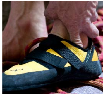
Passform: In den geschlossenen Lost Arrow passt seitlich noch ein Finger (li). Qualität: Die Verklebung der Verschlüsse beim Mad Rock löste sich schon am ersten Tag (re).