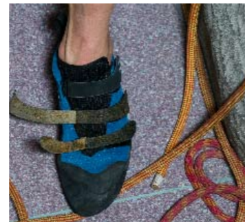
Echte Hallenkletterschuhe müssen nicht besonders sensibel sein denn auf den meist größeren Strukturen in der Halle ist defizientes Treten nicht Pflicht.

oben auf die Zehen. Und wenn man sich die Konstruktion der Zehenkappe genauer ansieht, weiß man auch schnell, warum das so ist. Der Urban Climber hat eine doppelte Gummikappe. Somit ist er natürlich robuster, aber eben auch etwas unflexibler. Man muss ihn etwas größer wählen. Auf Tritten vermittelte der Red Chili dann sogar ein ganz gutes Gefühl. Wenn Schuhe schon beim Anziehen irgendwo signifikant schmerzen, ist das sicherlich kein verkaufsförderndes Kriterium. Auffällig war das vor allem beim Edelrid Tornado. Jeder Tester klagte über einen starken Zug/Druck auf die Achillessehne. Das ist schade, denn der