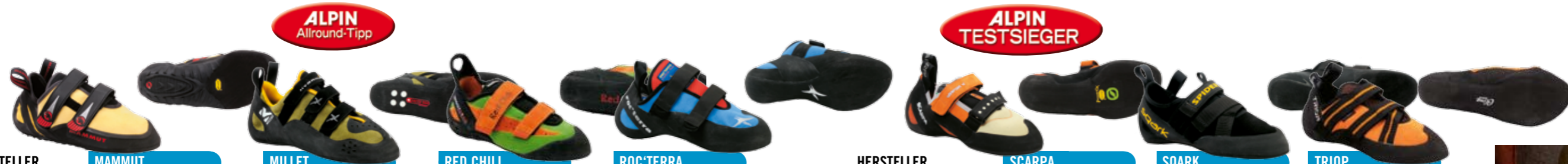
Das Klettern ist das eine, das Bewerten das andere. Im direkten Vergleich zeigen sich aber deutliche Unterschiede.